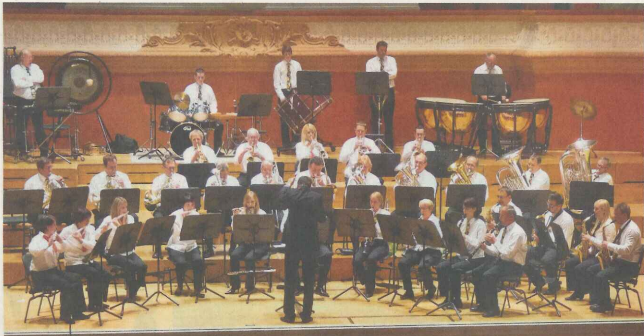
Der MV Ormalingen unterzieht sich der stillen Bewertung auf der Bühne im grossen Musiksaal.

Basel | Regionale Vereine an den Kantonalen Musiktagen