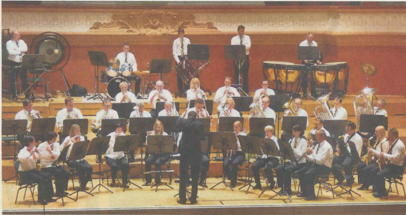
Der MV Ormalingen unterzieht sich der stillen Bewertung auf der Bühne im grossen Musiksaal.

Basel | Regionale Vereine an den Kantonalen Musiktagen