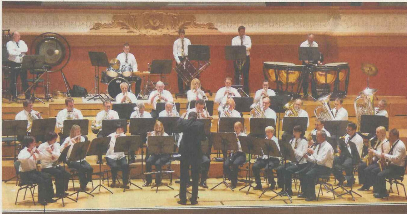
Der MV Ormalingen unterzieht sich der stillen Bewertung auf der Bühne im grossen Musiksaal.

Basel | Regionale Vereine an den Kantonalen Musiktagen