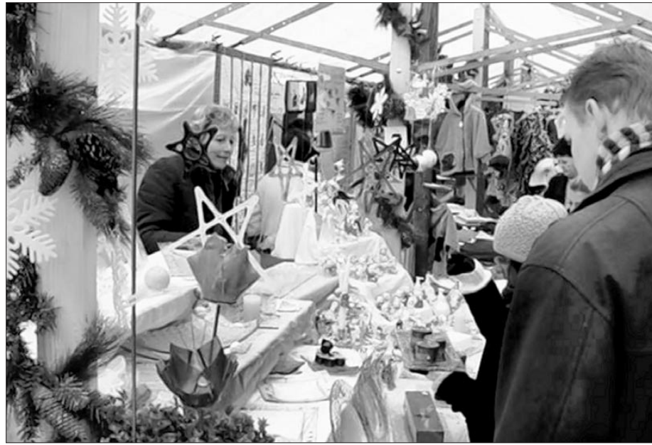
Alles was es für die Adventszeit und Weihnachten braucht und noch vieles mehr gibt's am Sissacher Adventsmarkt.